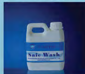
Topline Safe Wash