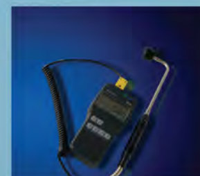
Topline Surface Contact Thermom