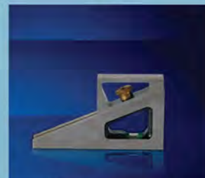
Topline Parallel Gauge