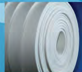
Topline Felt Blanket and Felt Doctor