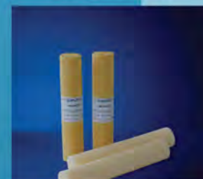
Topline Belt Safe Compound