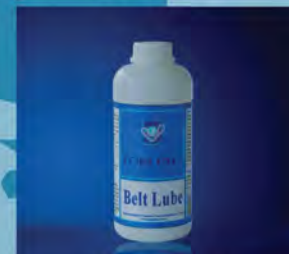
Topline Belt Lube